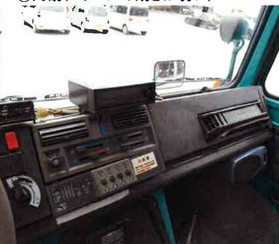
⑩内観(エアコンの効きが弱い)