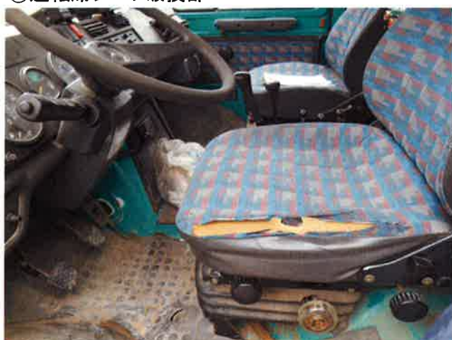
⑨運転席シート破損部