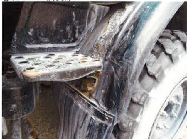
⑦右フロント腐食部