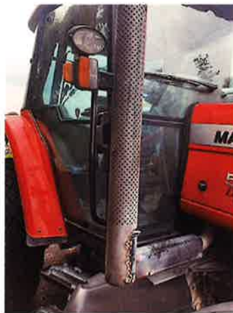
○マフラーカバーひび割れ。溶接応急修理跡あり