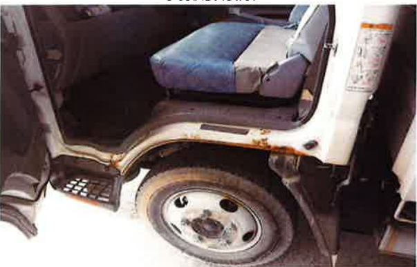
○キャビン左右一部腐食あり