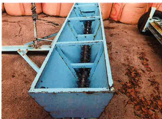
○ホッパー内部状況