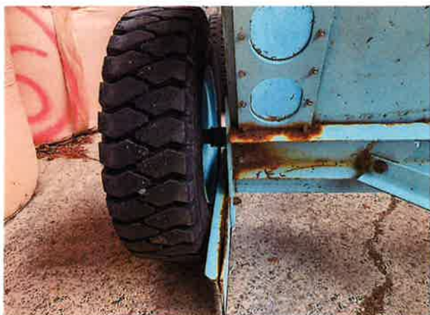
○左タイヤ周辺 腐食状況