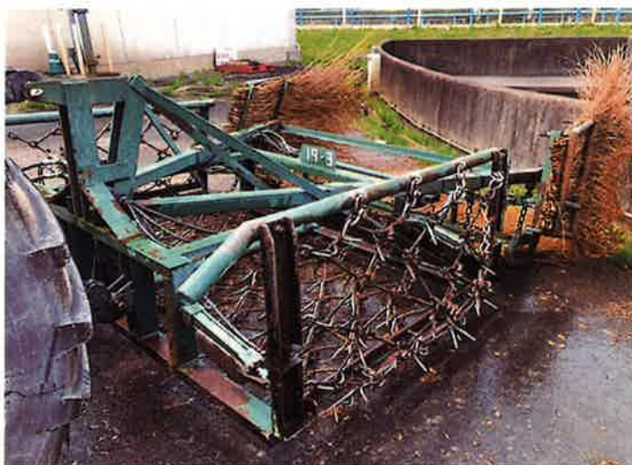
○現状姿 全景 側面より。油圧ホース一部劣化