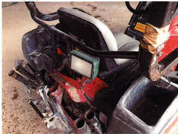
○後部作業灯 カバー不良