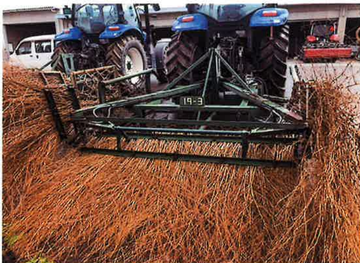
○現状姿 全景 後方より。油圧により開閉可能。