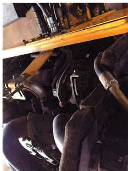
○エンジンルーム。除去できないポリトラックゴミ着