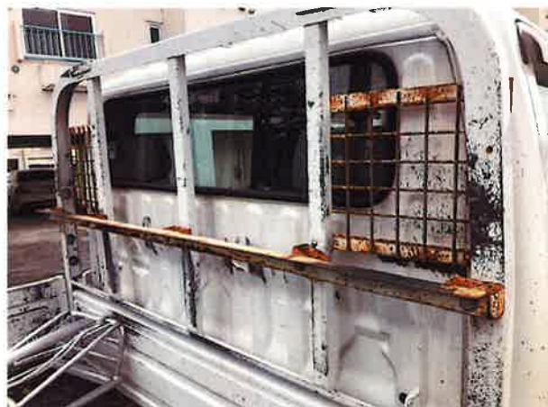
○キャビン後ろ状況 各所腐食進む