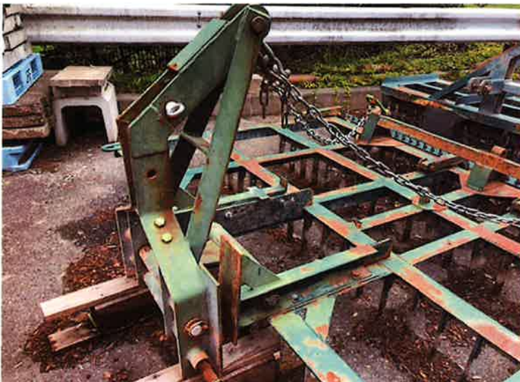
○トラクター3点リンク牽引部