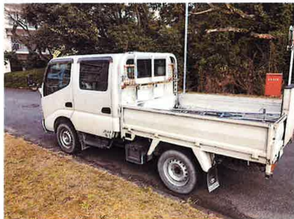
○現状姿(車体左側面)