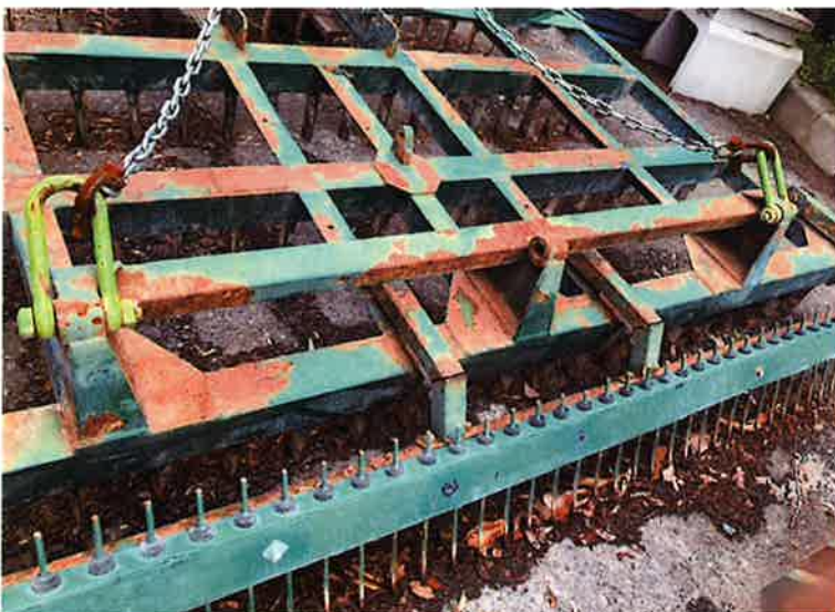
○フレーム拡大。各部腐食の進行が激しい