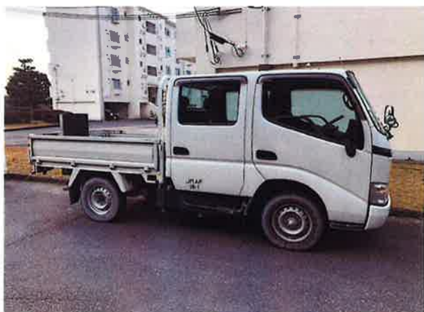
○現状姿(車体右側面)