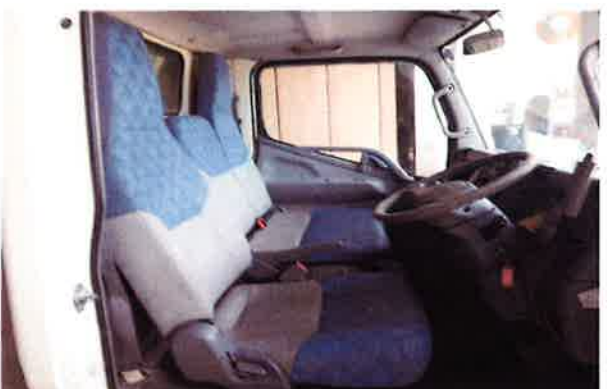
○キャビン内部状況