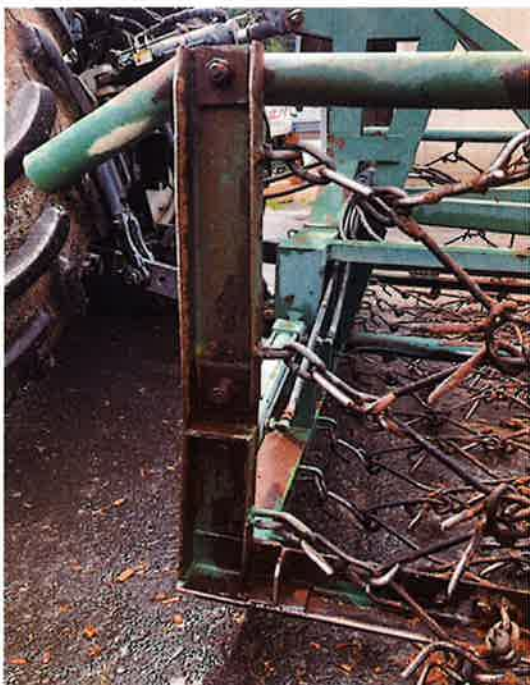
○フレーム拡大 腐食著しい。フレームにひずみ有り。