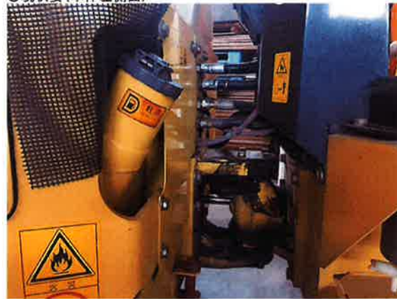
○油圧ホース 度々、オイルのにじみが見られる