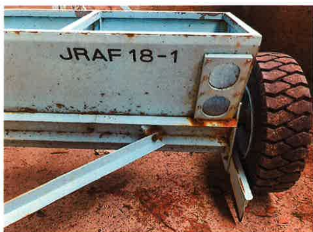
○右タイヤ周辺 腐食状況