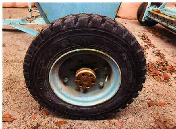
○タイヤ軸部腐食状況