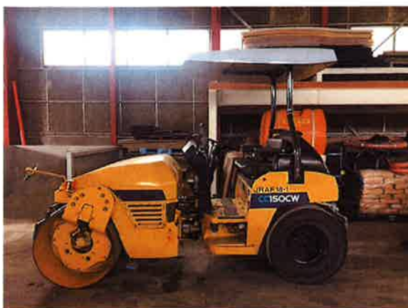
○現状姿(車体左側面)