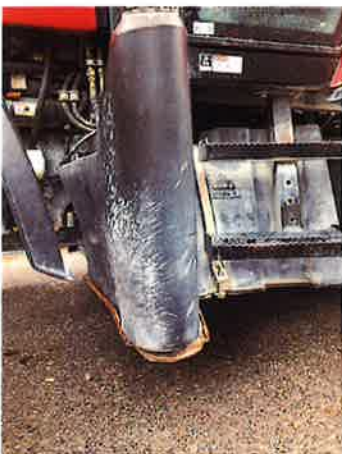
○燃料タンク土台腐食が激しい