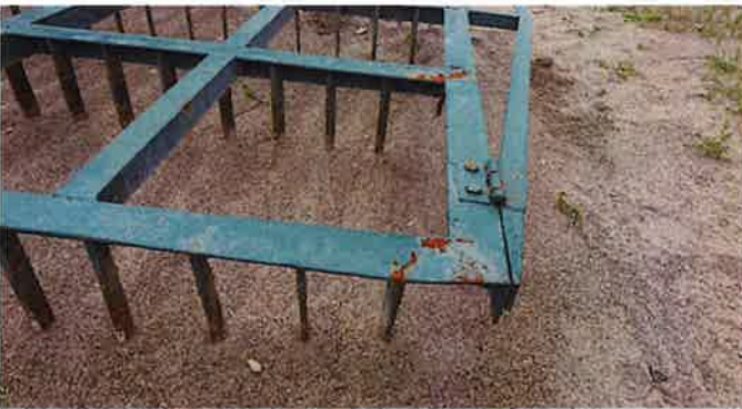
多少の腐食、歪みあり