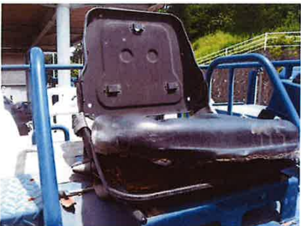
○上部放水銃 シートめくれ