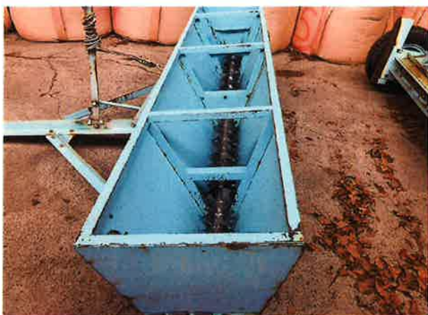
○ホッパー内部状況