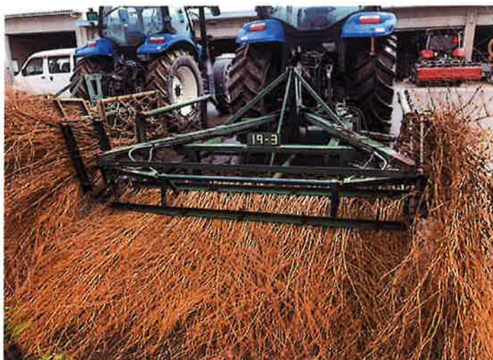
○現状姿 全景 後方より。油圧により開閉可能。