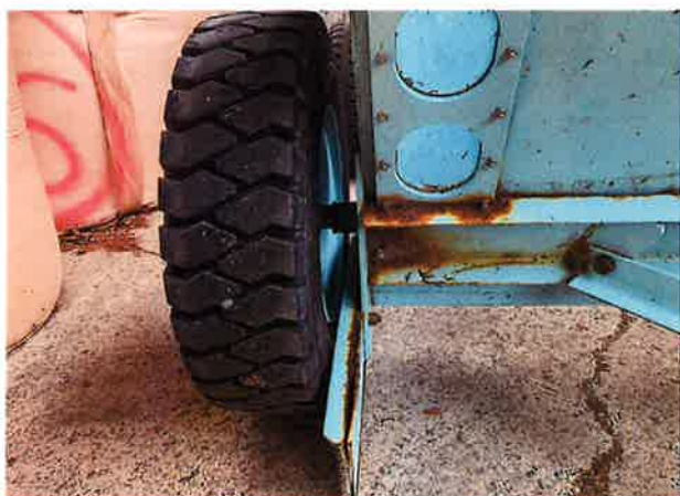
○左タイヤ周辺 腐食状況