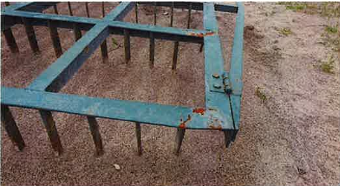
多少の腐食、歪みあり