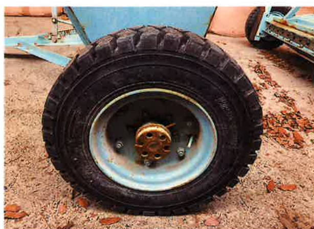
○タイヤ軸部腐食状況