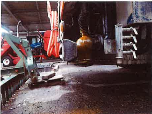
○右後部重力散水水漏れ