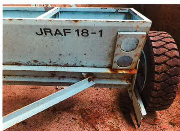
○右タイヤ周辺 腐食状況