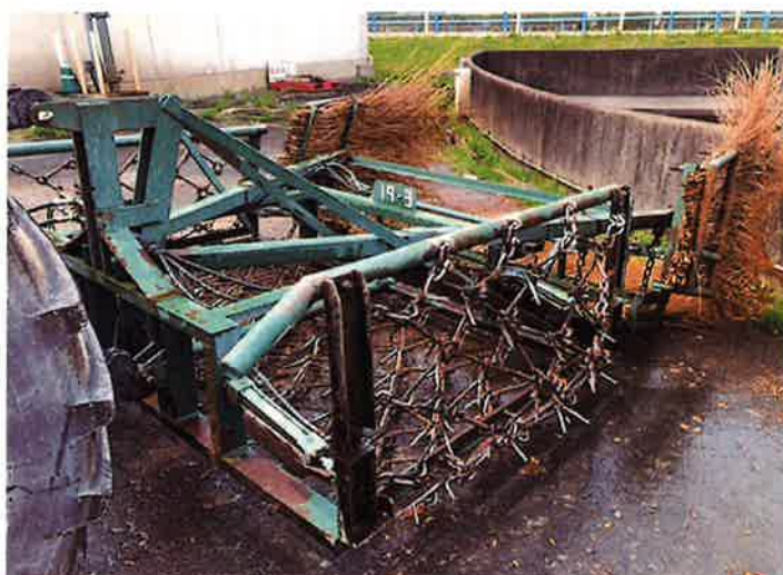
○現状姿 全景 側面より。油圧ホース一部劣化