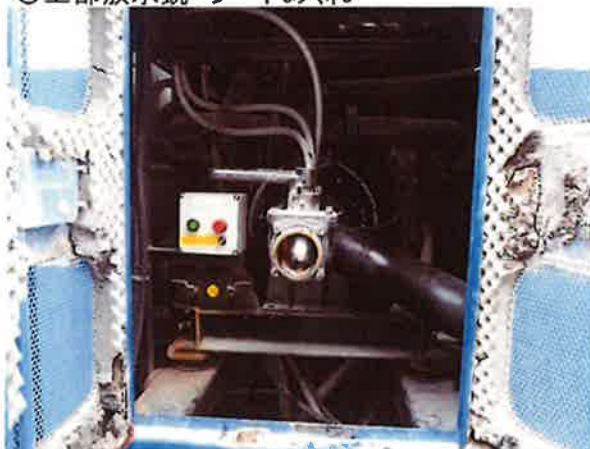
○真空ポンプクラッチ故障