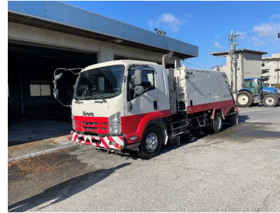
①外観(前方・左側面)