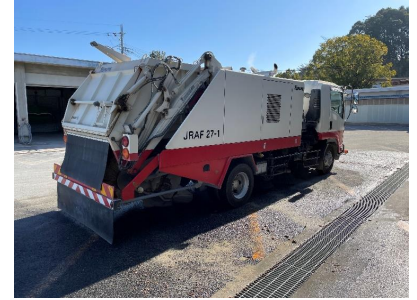
②外観(後方・右側面)