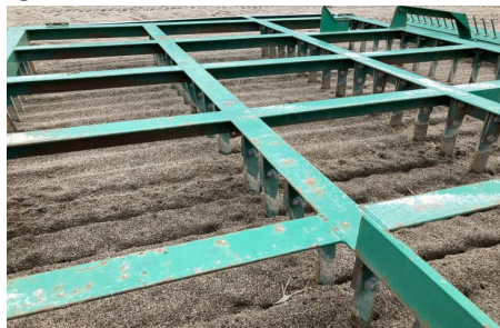
⑤多少の腐食、歪みあり